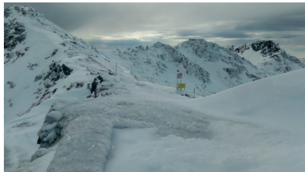
Carihuela del Veleta 15-12 -20