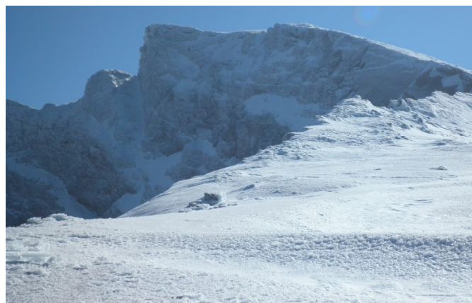
Vertiente norte 15-12-20