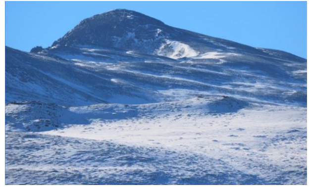
Cartujo y Caballo 7-12-21