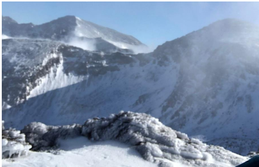
Hielo producido por la lluvia engelante 8-12-21