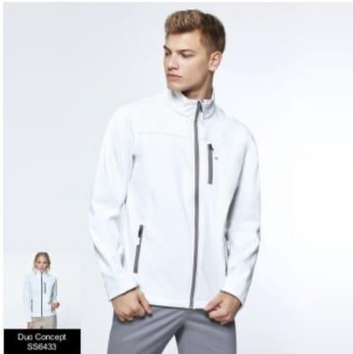
Duo Concept SS6433