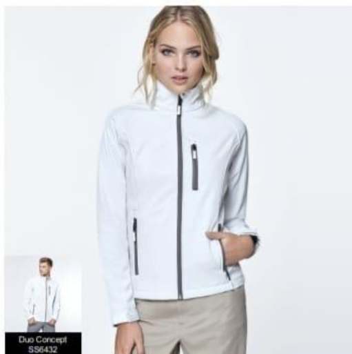
Duo Concept SS6432